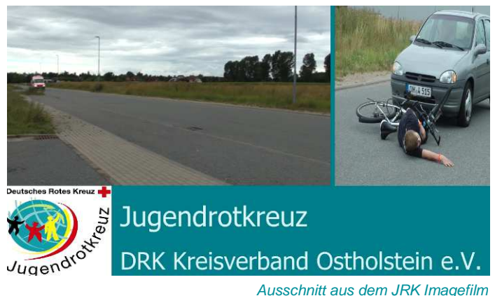
Ausschnitt aus dem JRK Imagefilm